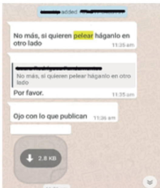
Figura 4. Integrante de familia solicita mejor comportamiento