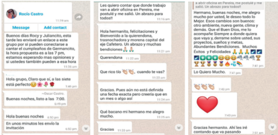
Figura 1. Grupo familia de WhatsApp