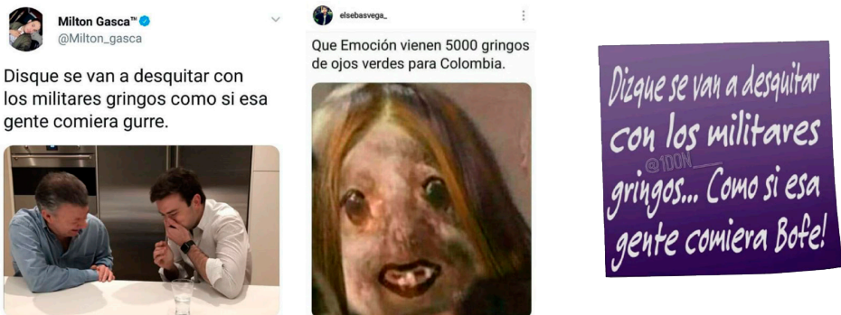
Figura 6. Publicaciones Twitter y Facebook

Ante la incursión militar, se esperaba que los roles de infidelidad se invirtieran esta vez a favor de las mujeres colombianas con los marines . Por su parte, los hombres venezolanos son totalmente invisibles en los memes analizados. No aparecen mencionados ni representados en ningún rol; incluso, en unos de los videos analizados los hombres colombianos piden que los deporten, mas no a las mujeres; en otro video, la presentadora habla de la posibilidad de reproducirse con estadounidenses, sin dejar entrever la posibilidad de tener hijos con venezolanos, así caiga el gobierno de Maduro.