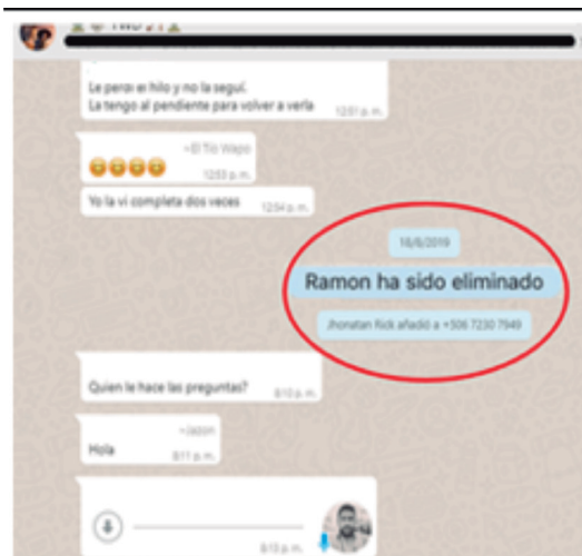
Figura 3. Integrante del grupo familiar es eliminado