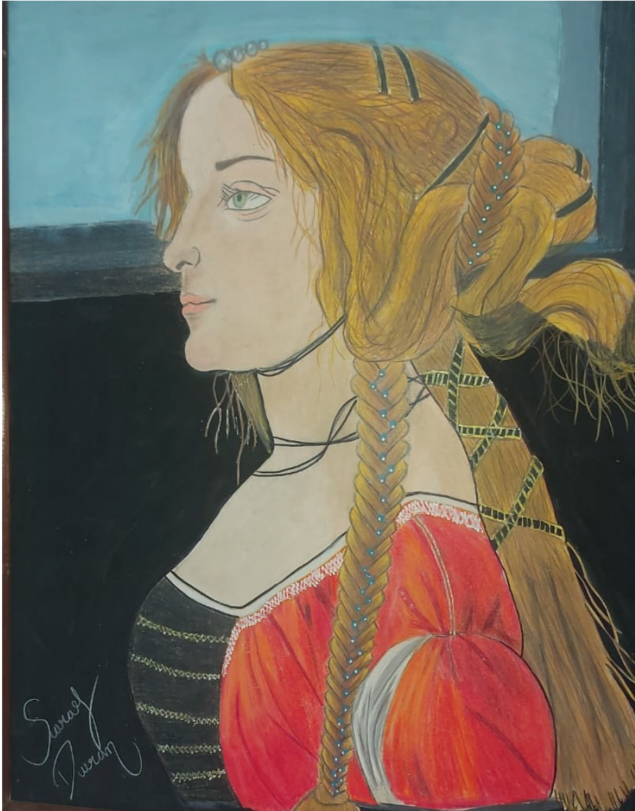
Nota. Obra "La Simonetta Vespucci" del escritor Sandro Botticelli, adaptado por Saray Duran. Materiales: utilizó solo colores y un boceto para afianzar sus trazos.