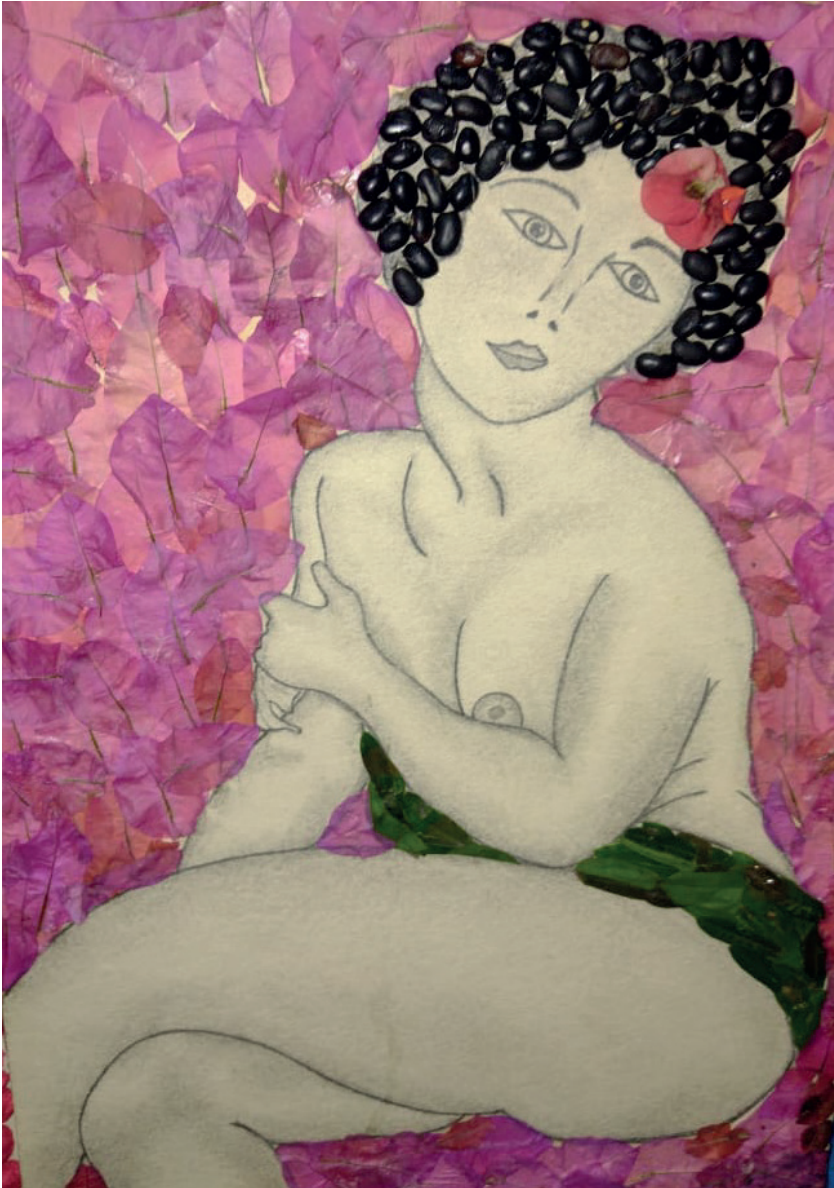
Nota. Obra "Prostitutas tumbadas" por Modigliani, adaptada por Scarleth León. Material: hojas, frijol, flores de primavera y tinta de lápiz.