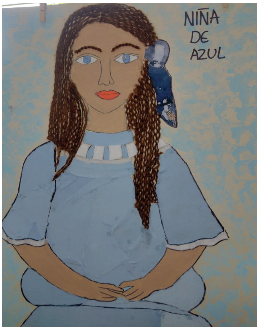
Nota. Obra "La niña azul" por Modigliani, adaptada por Lina Nova. Material: tela, lana y tempera