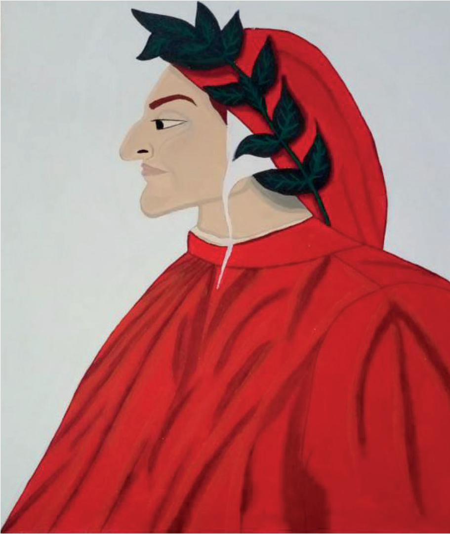
Nota. Nota. Obra “El infierno de Dante en la divina comedia” de Sandro Botticelli y adaptado por Sebastiana Verjel. Material: sólo tempera.