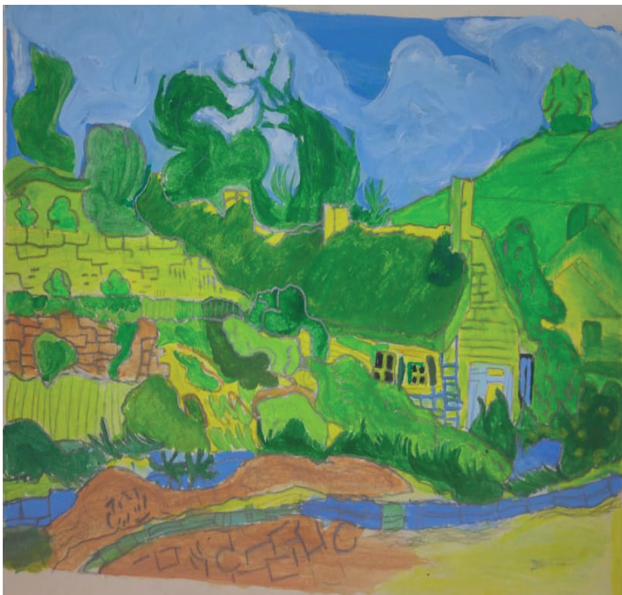
Nota. Obra "Thatched cottages at cordevile" de Vincent Van Gogh, adaptada por Miguel Parra. Materiales: uso de temperas.