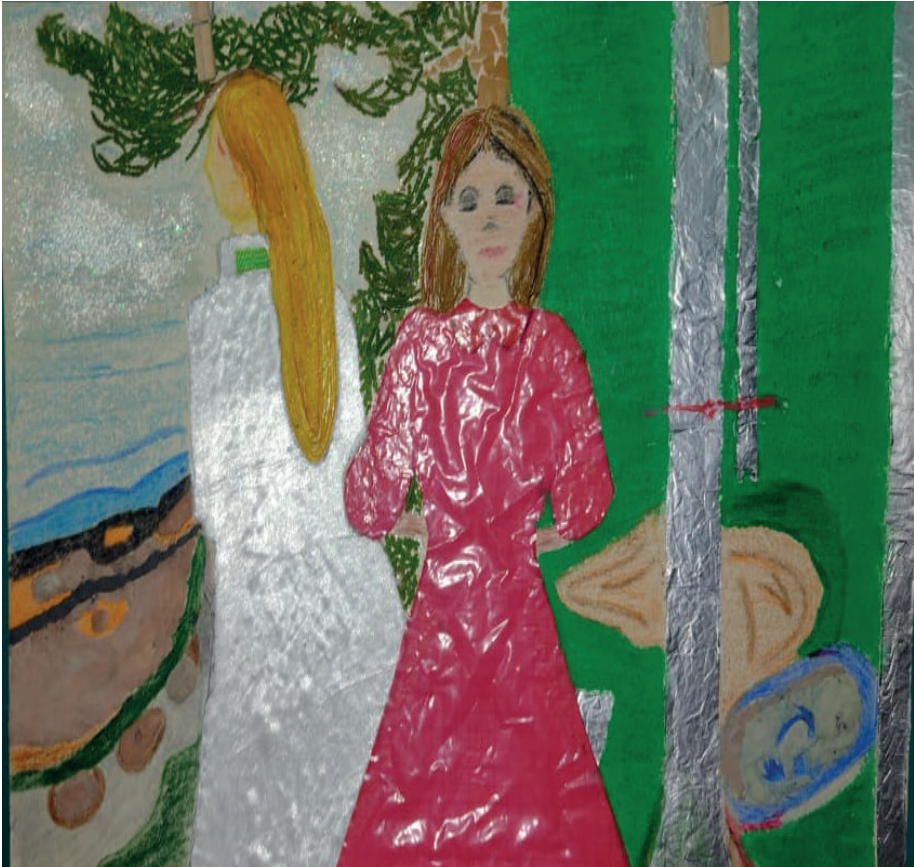
Nota. Obra "Rojo y blanco" por Edvard Munch, adaptado por Mouyi Rojas. Material: papel, plástico y aluminio.